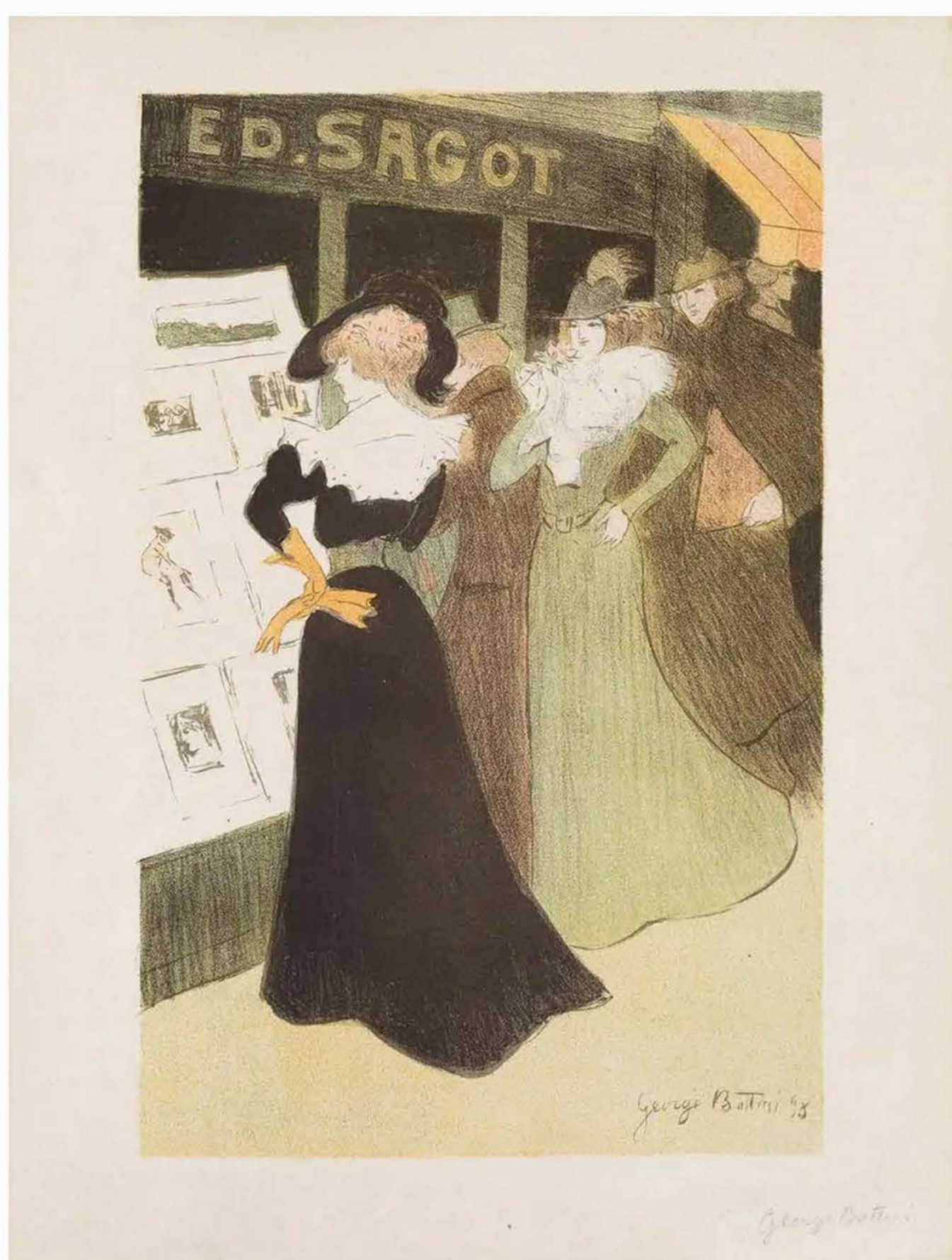
George Bottini, La vitrine de Sagot, 1898

Dopo il successo della sua prima edizione lo scorso anno, Paris Print Fair torna a Parigi dal 23 al 26 marzo 2023. 20 gli espositori protagonisti della fiera dedicata al mondo della stampa.