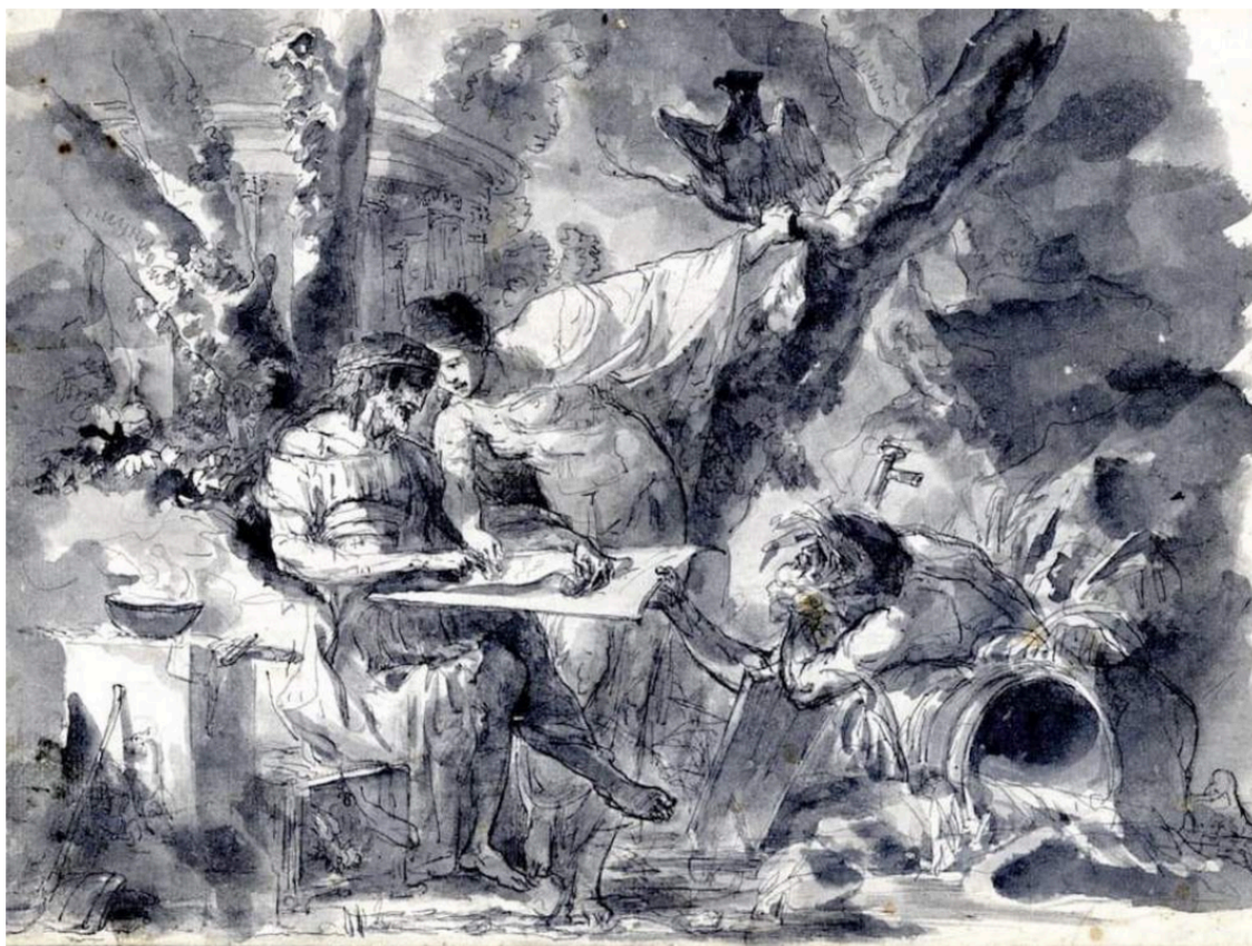
«Numa Pompilio e la ninfa Egeria», di Giovanni David alla Laocoon Gallery-W. Apolloni di Roma

Fogli antichi e contemporanei tra Salon du Dessin, Drawing Now Art Fair e Paris Print